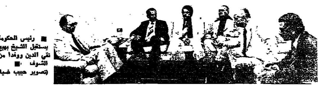
رئيس الحكومة يستقبل الشيخ بيجع في الدن وودوا من السويد

قال ان بغداد السراي الى قصر الجمهوري الاشتراكي في المحادثات اللبنانية اليركية سئل الرئيس الحصص عن رايه بموضوع استخدام بوليس دولي الى الحدود ، فاجاب : هذا السؤال يطرح بعد انتهاء المحادثات مع الوزير فانتس .